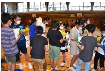
英語でインタビュー

7月13日(水)に弥栄小学校の体育館で、弥栄小学校の6年生11名と、滝沢小学校の6年生26名が交流会を行いました。約8か月後には、同じ中学校に進学する仲間として、互いのことを知るきっかけとすることをねらいとしています。