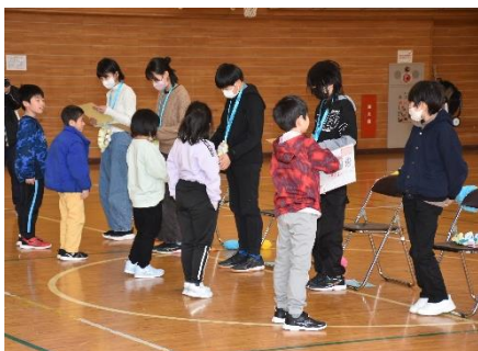
6年生に色紙のプレゼント

お世話になった6年生に感謝の気持ちを伝えることを目的に、5年生が中心となり、1～5年生全員で準備をしました。各学級からの発表では、呼びかけやクイズ、替え歌やダンスなどに工夫を凝らし、6年生への思いを伝えていました。6年生に贈った色紙には、一人一人の心のこもったメッセージが書かれていました。6年生からのお返しのダンスでは、「一緒にやりましょう。」という呼びかけに、下級生全員が嬉しそうに応じ、全校が一つになって盛り上がるシーンが見られました。