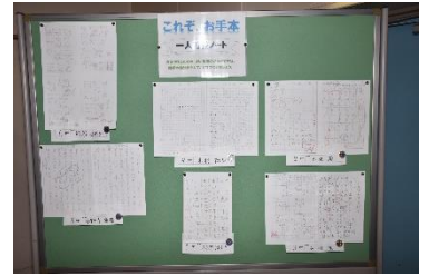
家庭学習ノート コピーの掲示