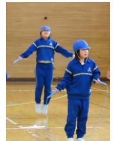
なわとび練習の様子